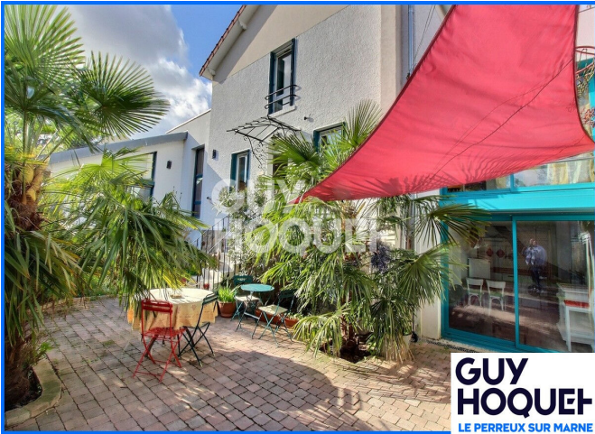
GUY HOQUET LE PERREUX SUR MARNE