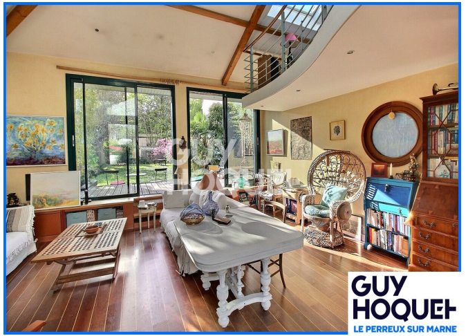
GUY HOQUET LE PERREUX SUR MARNE