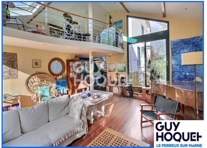
GUY HOQUET LE PERREUX SUR MARNE