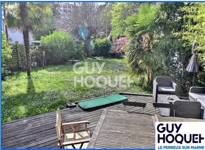
GUY HOQUET LE PERREUX SUR MARNE