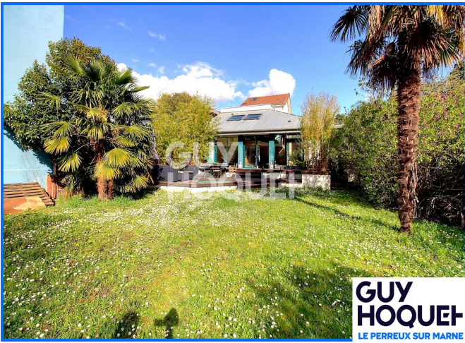
GUY HOQUET LE PERREUX SUR MARNE