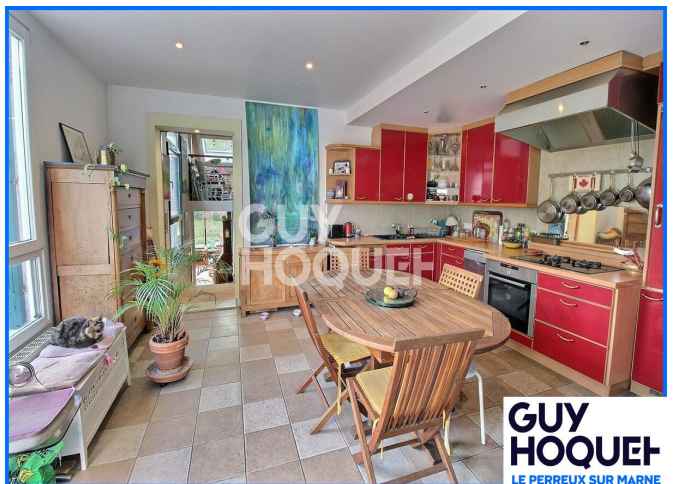
GUY HOQUET LE PERREUX SUR MARNE