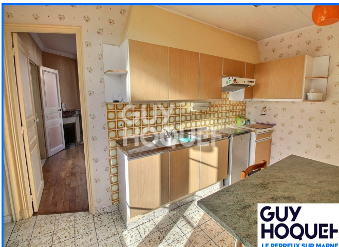
GUY HOQUET LE PERREUX SUR MARNE