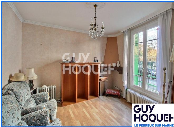
GUY HOQUET LE PERREUX SUR MARNE