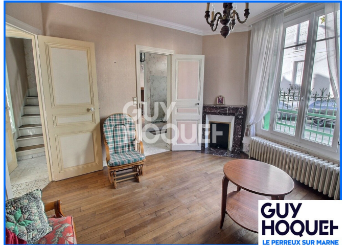
GUY HOQUET LE PERREUX SUR MARNE