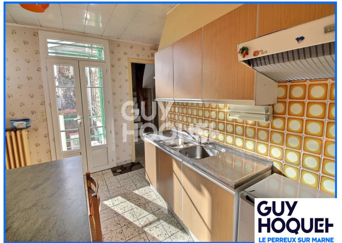
GUY HOQUET LE PERREUX SUR MARNE