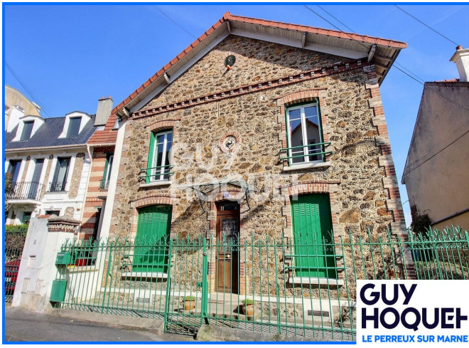
GUY HOQUET LE PERREUX SUR MARNE