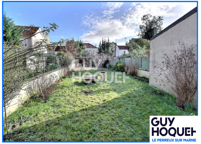
GUY HOQUET LE PERREUX SUR MARNE