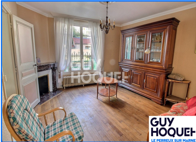
GUY HOQUET LE PERREUX SUR MARNE